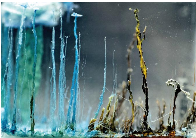
Figura 1. Jardines osmóticos obtenidos por la adición de cristales de sulfato de cobre y de sulfato ferroso a una solución de silicato de sodio

Tanto las proteínas (enzimas o no) como los ácidos nucleicos son producto del metabolismo, y son, en consecuencia, metabolitos. El metabolismo es una función que hace metabolismo; la organización del metabolismo y de los seres vivos es circular. Esta circularidad derivada de la necesidad que los entes vivos sean cerrados a la causa eficiente, tiene