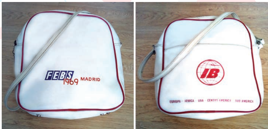
Figura 1 y 2

Una novedad en las reuniones de la época: la bolsa de viaje entregada a los asistentes a la 6ª Reunión de FEBS.